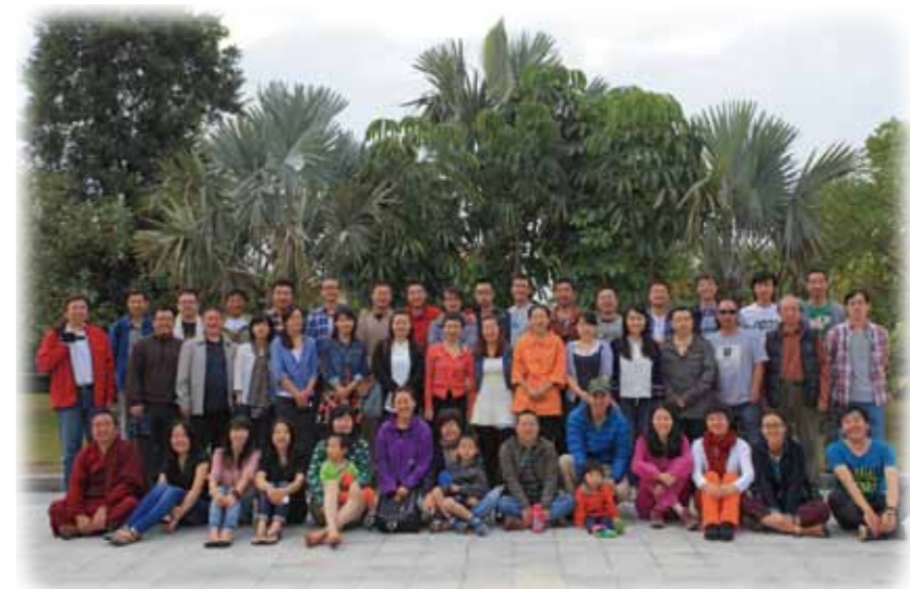
2013年山水全体成员合影